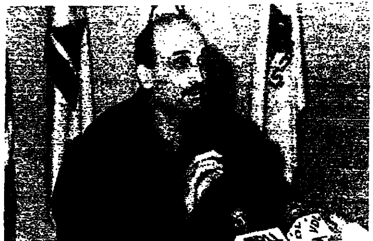
الدكتور جعجع خلال نوبته الصحافية (جوزيف فوفل)

شرح قائد القوات اللبنانية الدكتور جعجع بالتفصيل طرحه اعتمد الفيدرالية حلاً لازماً في لبنان. مجدداً الطرح مؤكداً على أهمية الاعتراف بواقع لبنان التعددي ومن ضمن الوحدة الوطنية كحل ثابت وواضح لازمة اللبنانية.